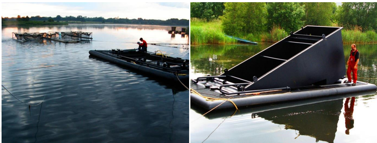
Abb. 1,2: Die Konstruktions-Konzepte werden durchgeführt teils mit einer Filter-Technik, welche in der ersten Stufe die anfallenden festen Partikel in dafür vorgesehenen Bereichen separiert und bis zur Verwertung sammelt. Bei einigen Anlagen folgt eine zweite Stufe in Form eines Bioreaktors in der eine Nitrifikation und Denitrifikation die gelösten Schadstoffe eliminiert. Ob mit oder ohne Monitorfish Sensoriksysteme ist die Wasserqualität innerhalb und außerhalb der Anlage kontrollierbar.

Doch kleine Anlagen sind auch für unsere regionale Teichwirtschaft interessant, sei es zur kontrollierbaren Winterung von Karpfen (K1, K2), zu deren Schutz vor Kormoranen, zur Brutaufzucht von Maränen bzw. Renken, zur Hälterung wie auch Mast von Zander oder Wels, für Sonderkulturen wie Störe oder einfach nur zum Darstellen von Zierfischen wie Koi oder Goldfisch.